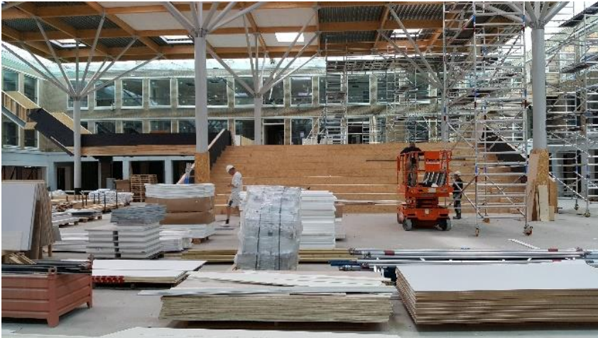
De ruime aula met achterin de tribune

De aannemer heeft in de vakantie doorgewerkt aan ons nieuwe schoolgebouw. Eind november beginnen we met de inrichting. De exacte verhuisdatum kan ik nog niet verklappen. Nog vóór de officiële opening zijn alle ouders welkom om een kijkje te nemen. U hoort spoedig meer.