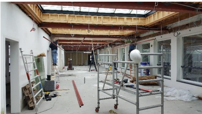
Op de tweede verdieping zijn grote daklichten voor de ecokas