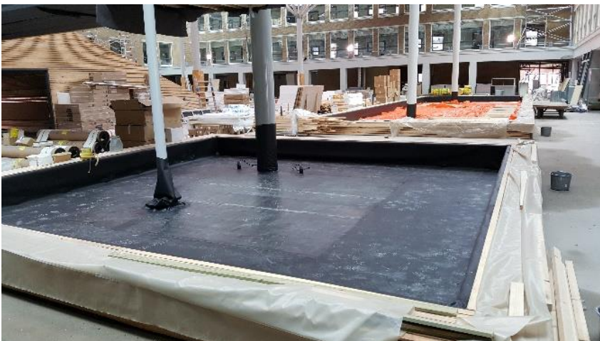
In de aula komen veel planten in twee grote plantenbakken